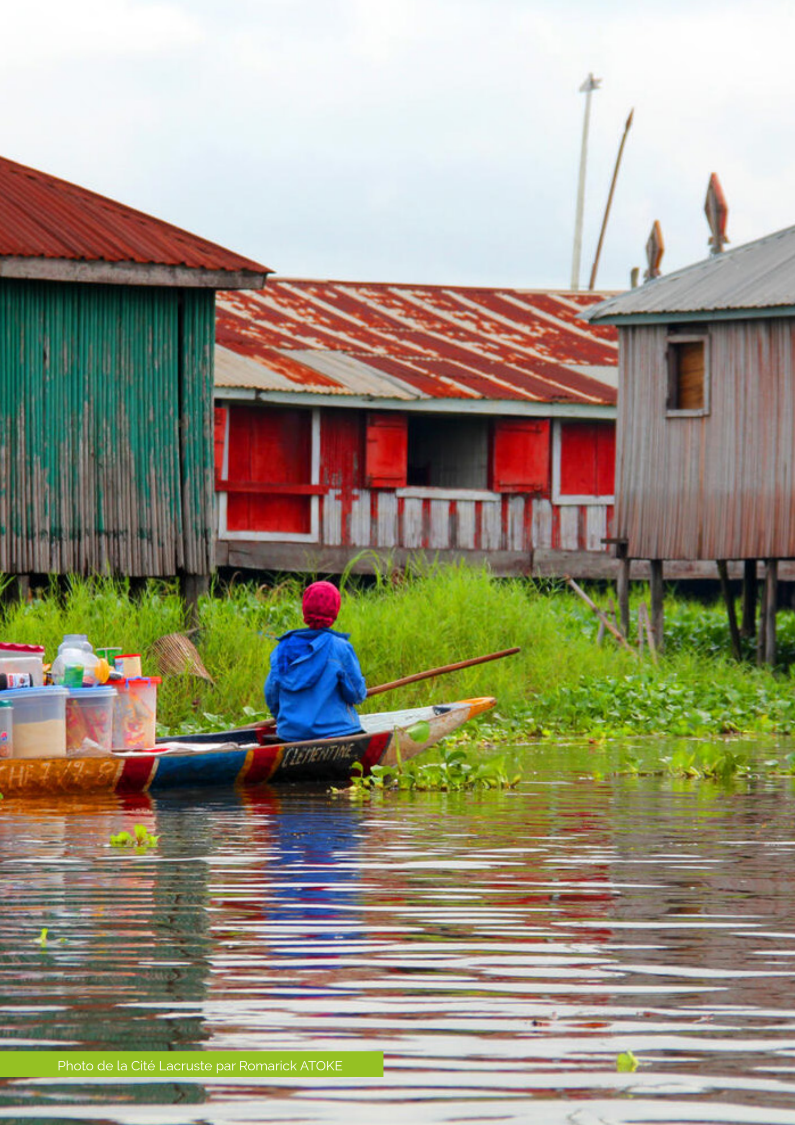
Photo de la Cité Lacruste